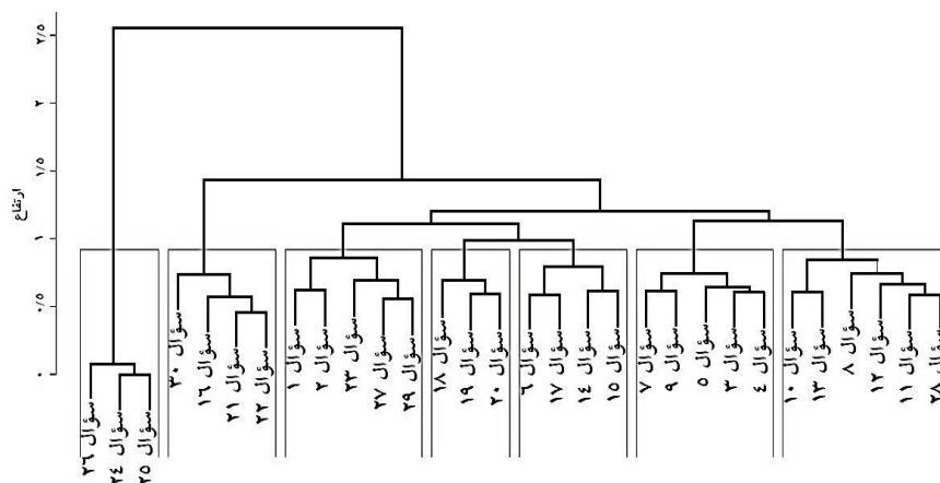
نمودار ۱: نمایش درختی (دندروگرام) ساختار سلسله‌مراتبی پرسشنامه توانایی‌های شناختی

نسبت (Ratio) برابر با ۰/۱۱۷ می‌باشد که کوچک‌تر از ۰/۳۶ می‌باشد و بنابراین براساس قاعده ۲، ساختار دو بُعدی به‌دست‌آمده یک ساختار دو بُعدی ساده تقریبی نیست. طبق جدول ۱، ماکزیمم مقدار شاخص PolyDETECT برای هفت خوشه به‌دست‌آمده است. مقدار این شاخص برابر با ۵/۹۷۷ و بزرگ‌تر از ۱ می‌باشد. بنابراین براساس قاعده ۱، ساختار توانایی‌های شناختی با در نظر گرفتن هفت خوشه (عامل یا بُعد)، یک ساختار چندبُعدی قوی می‌باشد. اما با توجه به این‌که مقدار به‌دست‌آمده شاخص PolyDETECT (۵/۹۷۷) کمتر از تعداد خوشه‌ها (۷) می‌باشد، نشان داد که ابعاد به‌دست‌آمده (براساس خوشه‌ها و سؤال‌های موجود در هر خوشه)، ابعاد مسلط یا غالب این ساختار نمی‌باشند. مقدار شاخص ساختار ساده تقریبی (ASSI) و شاخص نسبت (Ratio) به‌ترتیب برابر با ۰/۶۲۳ و ۰/۸۱۱ می‌باشند. با توجه به این‌که مقدار شاخص ساده تقریبی (۰/۶۲۳) با ۱ (ماکزیمم مقدار آن) فاصله نسبتاً زیادی دارد، براساس قاعده ۲ می‌توان بیان کرد که ساختار به‌دست‌آمده اگر چه یک ساختار چندبُعدی ساده تقریبی می‌باشد، اما یک ساختار چندبُعدی ساده تقریبی قوی نیست. همین استدلال در مورد شاخص نسبت (Ratio) نیز قابل‌بیان است. نمایش درختی (دندروگرام) ۱ ساختار سلسله‌مراتبی پرسشنامه توانایی‌های شناختی در نمودار ۱ ارائه شده است.