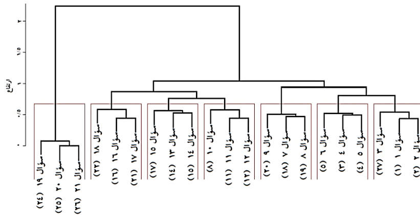
نمودار ۲: نمایش درختی (دندروگرام) ساختار سلسله‌مراتبی پرسشنامه اصلاح شده توانایی‌های شناختی

همچنین، براساس نتایج جدول ۳ و نمودار ۲، حداقل ابعاد لازم (بُعدیت ضروری) برای مدل‌سازی ساختار توانایی‌های شناختی براساس تعریف استوت (۱۹۹۰)، برابر دو می‌باشد. بُعد اول (شناخت غیراجتماعی) شامل ۱۸ سؤال و بُعد دوم (شناخت اجتماعی) شامل ۳ سؤال می‌باشد. طبق قاعده ۲ و با توجه به این‌که مقدار شاخص ساختار ساده تقریبی (ASSI) (-0/086) کوچک‌تر از 0/25 و مقدار شاخص نسبت (Ratio) (0/373) بزرگ‌تر از 0/36 می‌باشد، در مورد این‌که ساختار دو بُعدی توانایی‌های شناختی، یک ساختار دو بُعدی ساده تقریبی می‌باشد یا خیر، نمی‌توان اظهار نظر کرد. این یافته می‌تواند ناشی از نسبت تعداد سؤال‌های دو بُعد باشد (تعداد سؤال‌های بُعد شناخت غیراجتماعی ۶ برابر تعداد سؤال‌های بُعد شناخت اجتماعی می‌باشد). به عبارت دیگر، در نظر گرفتن یک ساختار دو بُعدی برای توانایی‌های شناختی دانش‌آموزان، جزئیات این ساختار را به خوبی مشخص نمی‌کند و لازم است عامل‌های سازنده هر یک از ابعاد نیز در این ساختار لحاظ شوند.